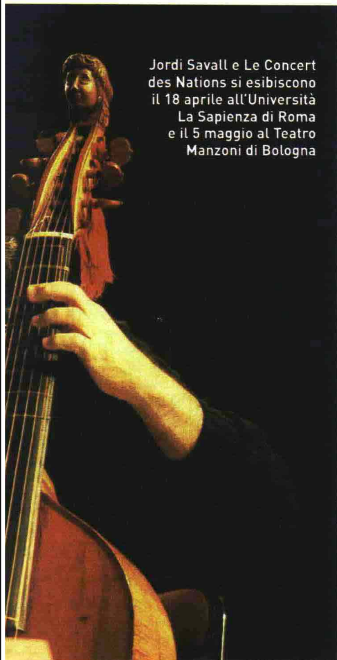
Jordi Savall e Le Concert des Nations si esibiscono il 18 aprile all'Università La Sapienza di Roma e il 5 maggio al Teatro Manzoni di Bologna