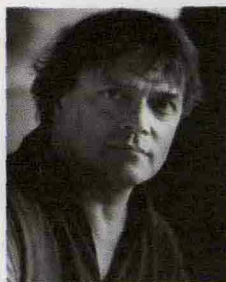
Jos van Immerseel Anima Eterna (gruppo residente del Concertgebouw di

Giunge al suo decimo giro di boa la rassegna "Due Organi in Concerto", da mercoledì 8 aprile alla Basilica di Santa Maria della Passione, che in tutti questi anni ha proposto un programma qualitativamente alto, sfruttando la dislocazione "stereofonica" delle due tastiere nello spazio della chiesa. Il primo appuntamento segna il debutto in Italia dell'orchestra belga