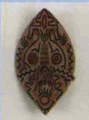
Un'opera in mostra HARING INAUGURALE

Da Padova a Milano. La Vecchiato Art Galleries, galleria padovana, apre in via Santa Marta 3. Per inaugurarla (mercoledì 8 alle 18.30) Dante Vecchiato, direttore artistico, ha voluto Keith Haring, artista scomparso nel '90, noto per il segno inconfondibile col quale ha dato vita a una miriade di piccole figure, umane e animali, che si agitano sulla tela. A cura di Luca Beatrice, la mostra è una selezione di opere eseguite dall'81 all'88, incluse alcune sculture (fino al 30 giugno; martedì-sabato 10-19.30). Un artista che ha privilegiato la dimensione del graffitismo per veicolare messaggi contro l'Aids, che l'ha ucciso, le droghe, la discriminazione omosessuale. (sdb)