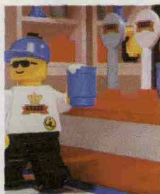
"Ceres by Night" di Bolcato

Street e pop art ispirano le opere dei venti giovani artisti chiamati a interpretare il mondo che gira attorno alla birra Ceres , come è già successo nella passata edizione, quando è stata creata la bottiglia limited edition dipinta