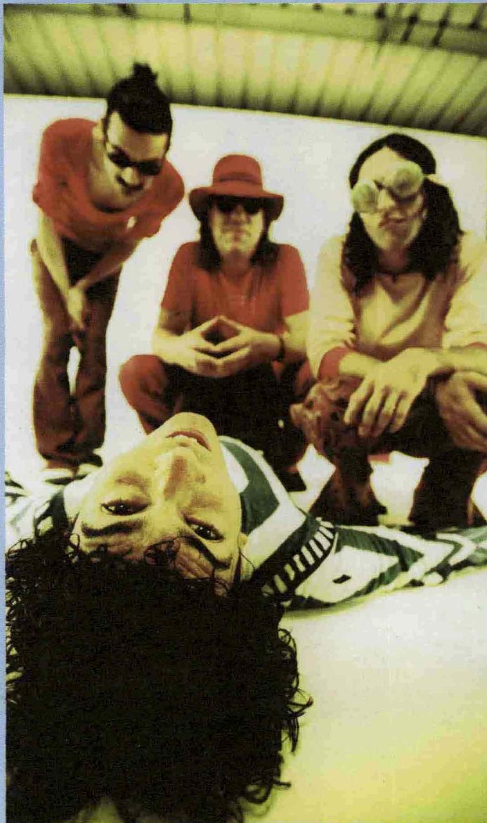
Gli Zen Circus suonano al Magnolia

Vagano tra punk e folk, sempre con grande personalità e senza compromessi. Sono i toscani Zen Circus, segnalati dal portale Rockit come una delle band più interessanti della scena indie rock italiana. Forti del successo dell'album Villa Inferno , nato dalla collaborazione con Brian Ritchie, membro fondatore degli americani Violent Femmes, e prodotto dall'etichetta bolognese Unhip, arrivano al Magnolia mercoledì 8 aprile. Un album, Villa Inferno , nobilitato anche dalla cover di Wild Wild Life dei Talking Heads con Jerry Harrison alle tastiere che suonava con la formazione originale di David Byrne & C. Il Magnolia è all'Idroscalo (via Circonvallazione Idroscalo 41, Segrate; www.circolomagnolia.it ). Una serata quella del circolo Arci che schiera anche i Criminal Jokers e propone in chiusura il djset di Dj Bronx. Ore 21.30. Ingresso gratuito con tessera Arci.